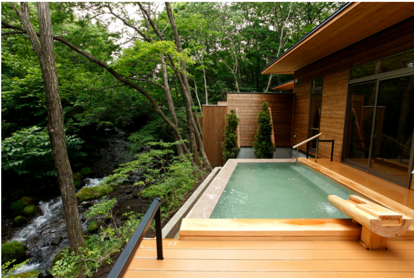
みやぎ蔵王遠刈田温泉「ゆと森倶楽部」

宮城県内に4つの温泉リゾートを運営する一の坊グループ(本社/宮城県仙台市)では、使用エネルギーの無駄を見直し、段階的に地球環境にやさしい温泉リゾートに改善していく快適エコ活動を2017年度から行っております。