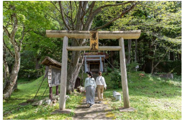
湯の神様として奉られている「湯神神社」