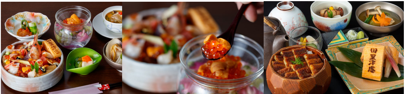
▲【3/3～4/30 期間限定】雲丹といくらの春めく飾り箱はかけ足し雲丹いくら付き！ ▲春夏限定「あまきご膳」

田里津庵は宮城県の「選ぶ！選ばれる！！みやぎ飲食店コロナ対策認証制度」の認証を受けております。