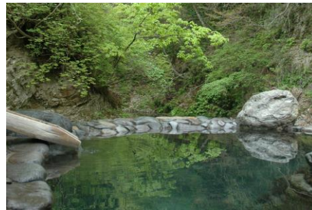
心を整え、穏やかな時間を過ごす「里山リトリートステイ」

■靴を脱いでくつろげる「温泉倶楽部／ダブル(30㎡)」の部屋は、2022年2月にひとり旅のためのお部屋として設えを変更しました。快適な眠りのための、米シモンズ社製のダブルベッド「リュクスシリーズ」を採用。お部屋には、読書のための背もたれや足をのせて休めるオリジナル三角クッション、湯めぐりに最適なワッフル生地のリゾートウェアを用意しています。